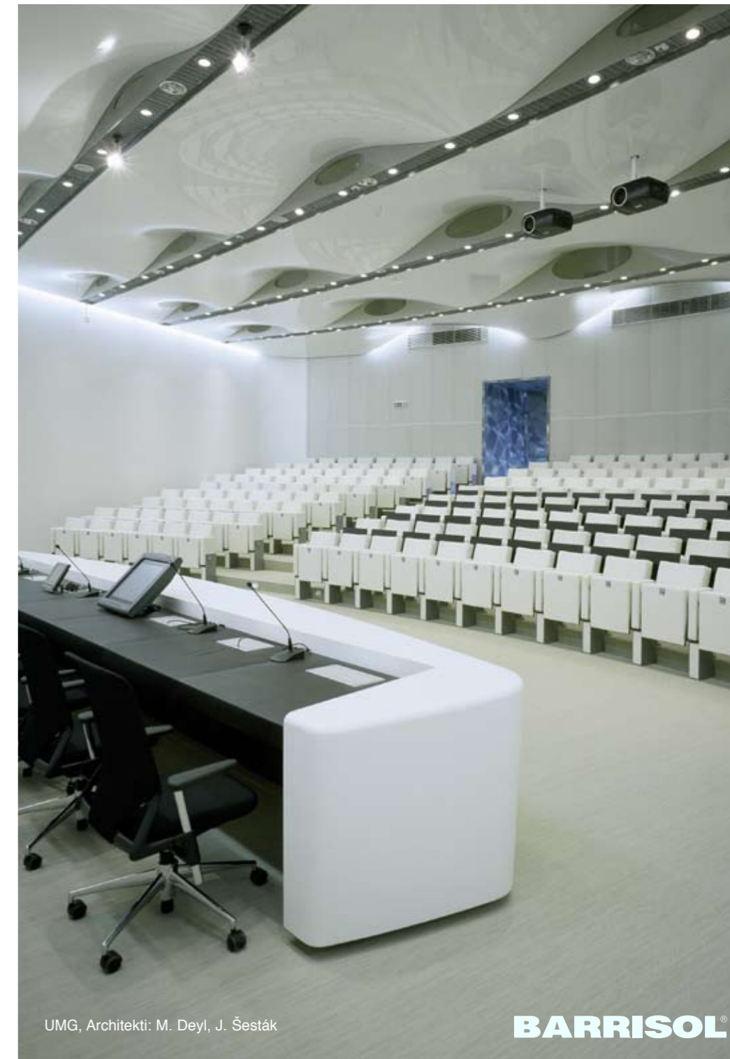
UMG, Architekti: M. Deyl, J. Šesták