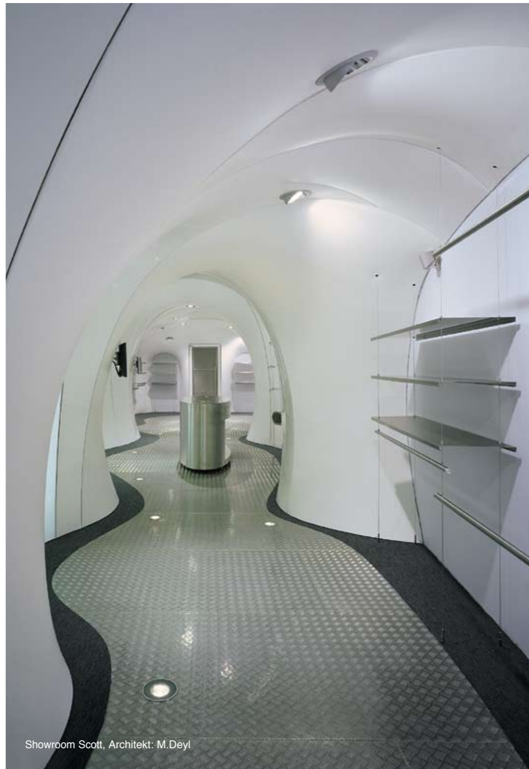
Showroom Scott, Architekt: M.Deyl

Volit můžete ze dvou typů obvodových lišt. Lišta viditelná je plastová, 3 cm široká standardně je bílá, na přání je možno ji dodat ve zvolené barvě stropu. Skrytá lišta Star je hliníková. Při jejím použití po obvodu místnosti vzniká pouze sedmimilimetrová spára, buď černá, nebo bílá, která však při zběžném pohledu zcela uniká pozornosti.